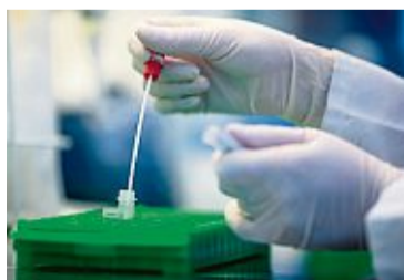
Die Proben kommen vom Wattestäbchen in eine Ampulle.