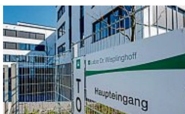
Das Labor in Köln-Marsdorf

sind wir schon froh.“ Als hier am 25. Januar der erste Abstrich auf Corona getestet wurde, beging China gerade sein Neujahrsfest. Die Millionenstadt Wuhan, das Epizentrum der Corona-Pandemie, war da vor wenigen Tagen in Quarantäne versetzt worden. Einen Monat später feierte Köln nahezu unbeschwert Karneval. Auch das ist nun einen Monat her und die Zahl der Proben ist hier bei 35 000 angelangt. Jeden Test bezahlen die Krankenkassen mit 59 Euro. Die meisten stammen aus Nordrhein-Westfalen, wenige aus den Niederlanden, Niedersachsen, und Rheinland-Pfalz, wo die Kapazitätsgrenzen schon erreicht sind. Zwischenzeitlich kamen große Schwünge aus Heinsberg, der am meisten betroffenen Region in NRW.