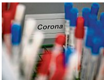
Wattestäbchen in Glasröhrchen